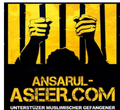
Verbotener salafistischer Verein „Ansarul-Aseer“