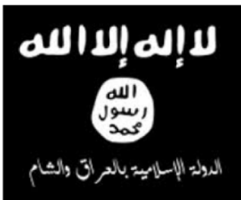
Flagge des „Islamischen Staates“