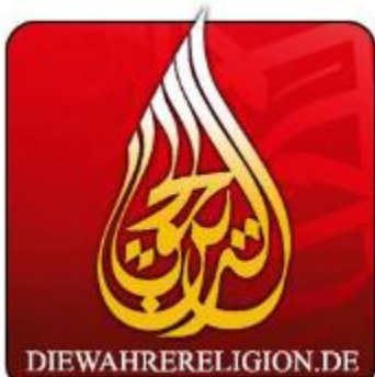
Salafistisches Netzwerk Die Wahre Religion