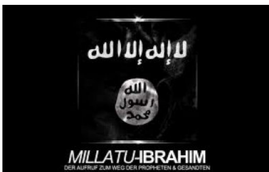
Verbotener salafistischer Verein „Millatu Ibrahim“