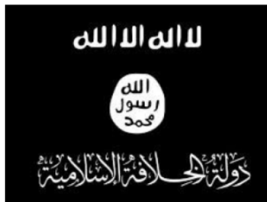
Flagge des „Islamischen Staates“