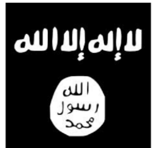
Flagge des „Islamischen Staates“