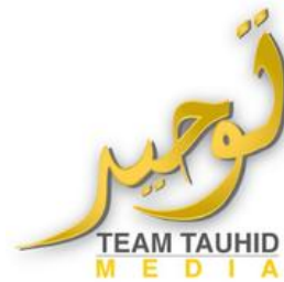
Verbotener salafistischer Verein „Tauhid Germany“