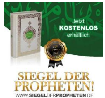
Koranverteilung „Siegel der Propheten“