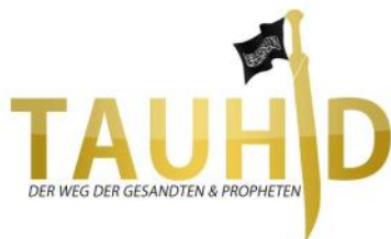
Verbotener salafistischer Verein „Tauhid Germany“