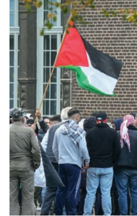
مظاهرات مؤيدة لفلسطين في برين

يعتبر حق التجمع والتظاهر من الحقوق المكفولة في المجتمعات الديمقراطية، حيث يُمكن للمواطنين التعبير عن آرائهم وقضاياهم علناً والتجمع بسلام. إنه أحد أسس المشاركة السياسية، ويتمتع بحماية خاصة من الدستور.