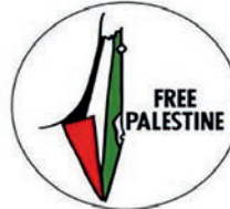
العلم الفلسطيني داخل حدود إسرائيل

أمثلة توضح ذلك: لا يتعلق الأمر بمجرد انتقاد دولة إسرائيل بل يتعداه إلى معاداة للسامية ذي صلة بإسرائيل، عندما يتم إنكار حق وجود إسرائيل، عندما يتم تطبيق معايير مزدوجة (أي عندما يُتوقع من إسرائيل سلوكاً مختلفاً عما يُتوقع من دول ديمقراطية أخرى)، عندما يتم استخدام صور أو رموز لوصف إسرائيل أو سكانها ترتبط بمعاداة السامية التقليدية، عندما يتم تحميل المسؤولية جماعياً لليهود عن أفعال دولة إسرائيل، أو عندما تتم مقارنة السياسة الإسرائيلية بالسياسة الوطنية لإشتركيةنازية.