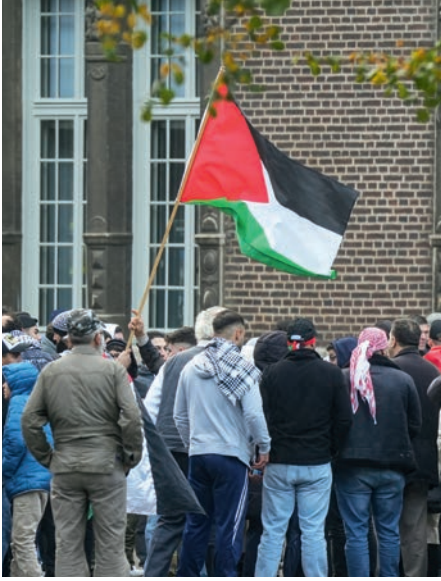
Bremen'de Filistin yanlısı gösteriler

Toplanma ve gösteri yapma hakkı, demokratik toplumlarda vazgeçilmez bir hak. Bu hak, vatandaşların görüşlerini ve isteklerini kamuoyuna barış içinde bildirmesine fırsat tanır. Vatandaşların siyasi katılımlarının çok önemli bileşenlerinden biridir, dolayısıyla temel bir hak olarak anayasa hukuku kapsamında da özel olarak korunur.