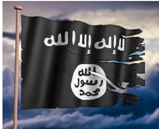
In Deutschland verbotene Flagge des sogenannten Islamischen Staates (IS)

Der Begriff „ Legalistischer Islamismus “ beschreibt hingegen Organisationen, die eine Veränderung der Staats- und Gesellschaftsordnung zugunsten eines islamistischen Staatswesens über die politische Einflussnahme anstreben. Sie lehnen Gewalt ab und bewegen sich im hiesigen Rechtsrahmen, den sie jedoch langfristig zu unterwandern und abzuschaffen versuchen (z. B. die „Muslimbruderschaft“).