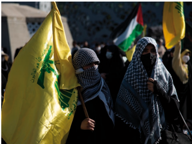
Anhängerinnen der in Deutschland verbotenen Terrororganisation „Hizb Allah“

Daneben gibt es Anwerbeversuche von Islamist:innen im realweltlichen Bereich, zum Beispiel über öffentliche Protestaktionen, Infostände oder sogenannte Islamseminare. Hierbei passen sie ihre Propaganda an ihre jeweiligen Zielgruppen (Frauen, Männer, Jugendliche, Kinder) an. Ihnen versprechen sie zumeist eine bessere Welt unter ihren Vorstellungen von religiöser Herrschaft.