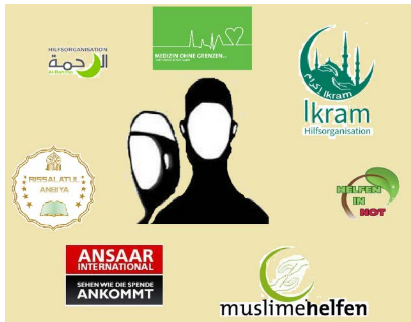
Hilfsorganisationen „Ansaar International“ „al-Rahma“ „Ikram“ „Medizin ohne Grenzen“ „Helfen in Not“ „Muslime helfen“ „Risalatul Anbiya“